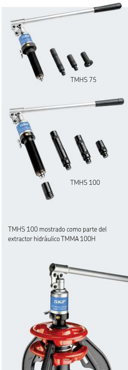
TMHS 100 mostrado como parte del extractor hidráulico TMMA 100H

Generación de fuerzas de extracción sin esfuerzo