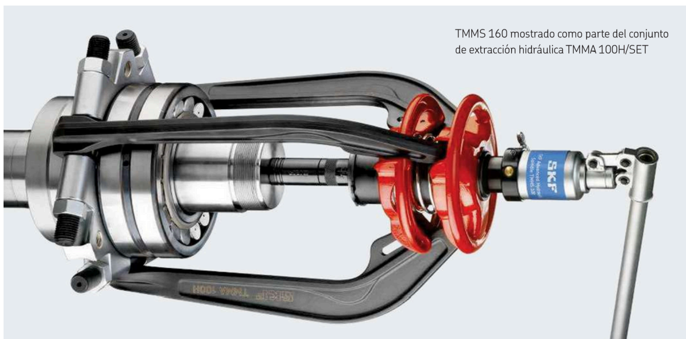
TMMS 160 mostrado como parte del conjunto de extracción hidráulica TMMA 100H/SET